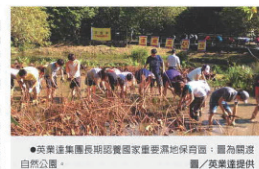
●英業達集團長期認養國家重要溼地保育區，圖為關渡自然公園。

多年來，英業達透過永續管理體系，對綠能環保及社會參與的長期投入與努力，在實質成效上，屢獲各界的高度肯定，榮獲「中華民國企業環境保護獎」、「行政院勳獎一等獎」、「新能獎」、「台灣企業永續獎」及「天下企業公民獎」等榮譽獎項。