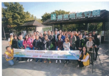
科技大廠英業達積極投入溼地保育，以鄰近公司總部的關渡溼地為起點。

以 2019 年為例，英業達就資助了 6 個場次的偏遠地區學校溼地環境教育旅程。從宜蘭到新竹，6 個縣市的偏遠