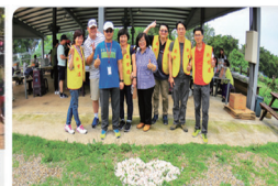
●英業達集團長期認養國家重要溼地保育區，圖為關渡自然公園。